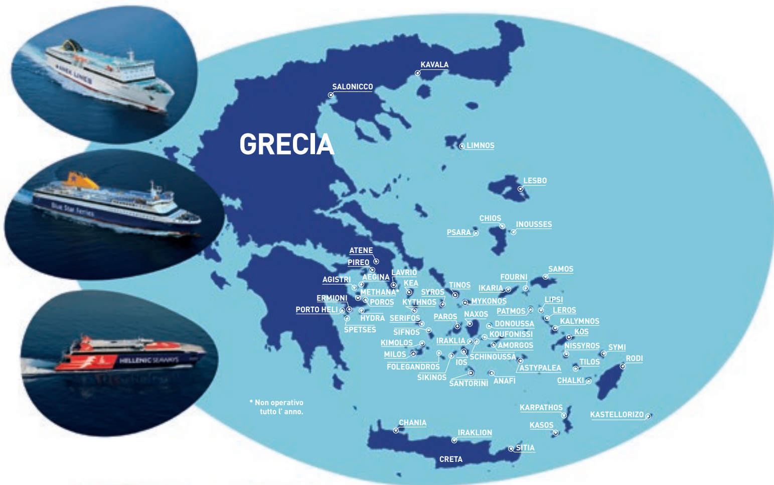
Tinos Beach Hotel

www.bluestarferries.com , www.hsw.gr e www.aneq.gr , presso la vostra agenzia di viaggio oppure chiamate il numero (+30) 210 8919800.